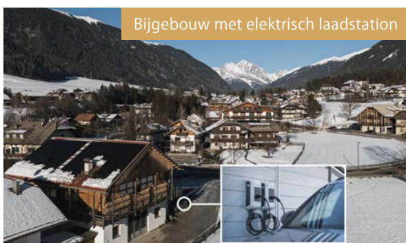
Bijgebouw met elektrisch laadstation