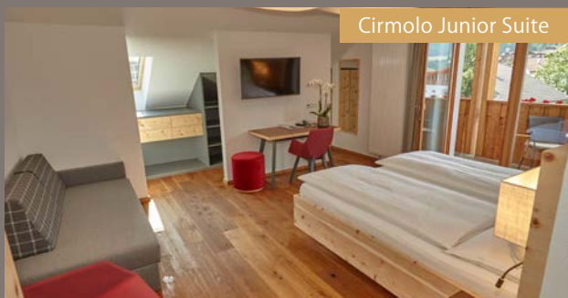
Cirmolo Junior Suite