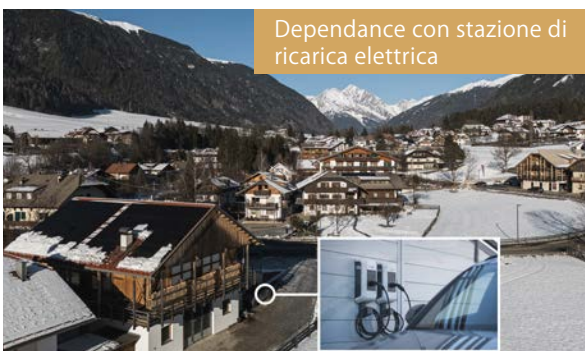
Dependance con stazione di ricarica elettrica