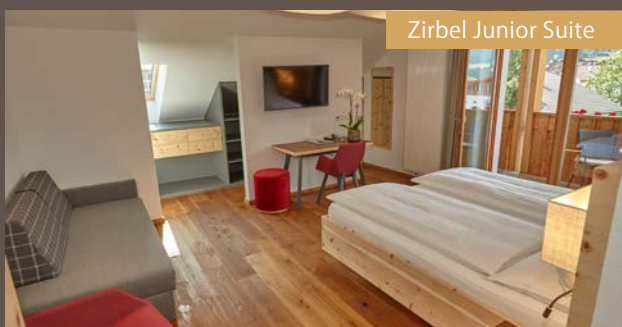
Zirbel Junior Suite